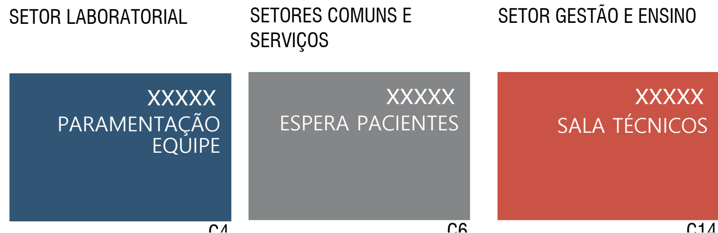
03 EXEMPLOS ESCALA 1/5